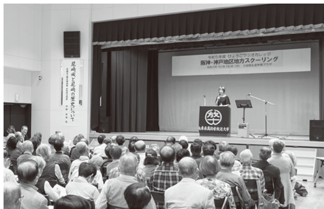
地方スクーリングの様子