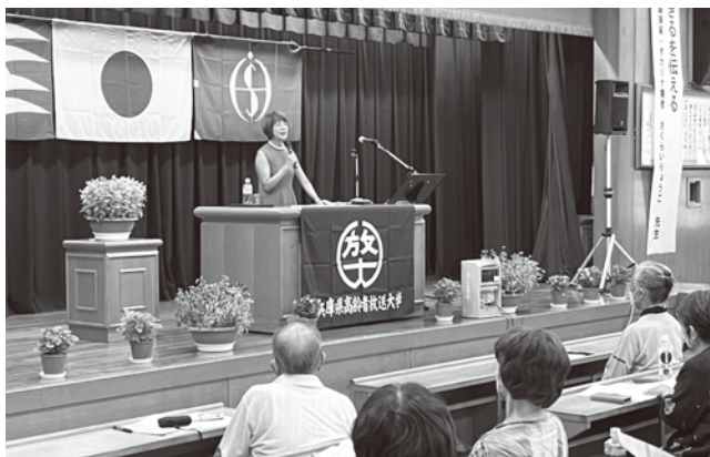
中央スクーリングでの講義